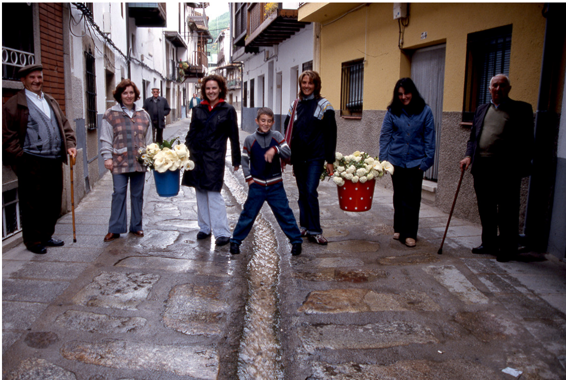
El montaje de los arcos era cosa de hombres. Las mujeres, igual que ahora, participarían en su decoración. Año 2003.