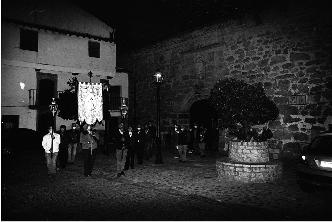
Procesión de la cofradía del Rosario en Villanueva de la Vera. Octubre de 2021.

Esta es la última fecha en la que tenemos noticias de las 7 cofradías de Valverde. Nos parece excesivamente temprana para el fin de todas las hermandades; hay que tener en cuenta que en Villanueva y Viandar aún, en el año 2025, siguen funcionando varias; algunas, como la del Rosario, con el mismo nombre que la de Valverde.