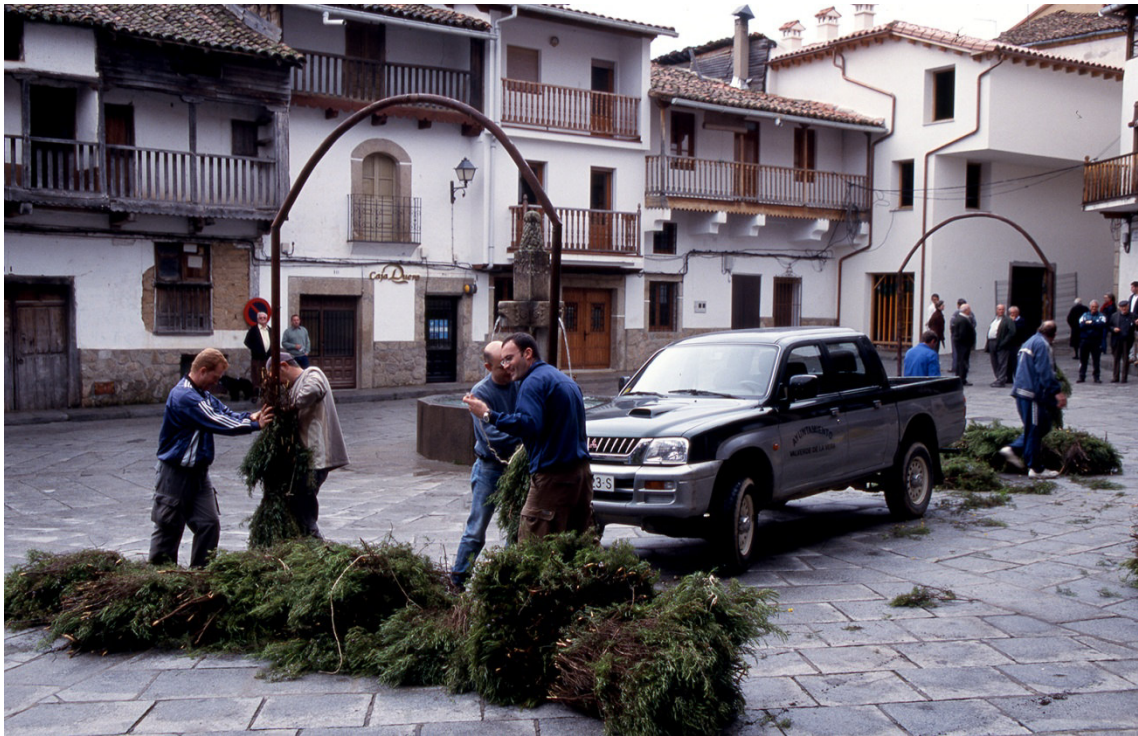
A pesar de la extinción de la cofradía el rito de los arcos sigue celebrándose en la actualidad. Abril de 2003.