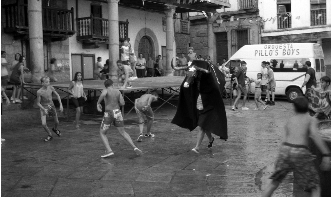
El toro de varillas.

armazón compuesto por dos varas estrecha a cuyos extremos van dos cuernos y un rabo de vaca y correteaba por el pueblo amedrantando a los vecinos". No es difícil identificar este rito con el Toro de Varillas que se celebra, cada vez con menos frecuencia, en Valverde.