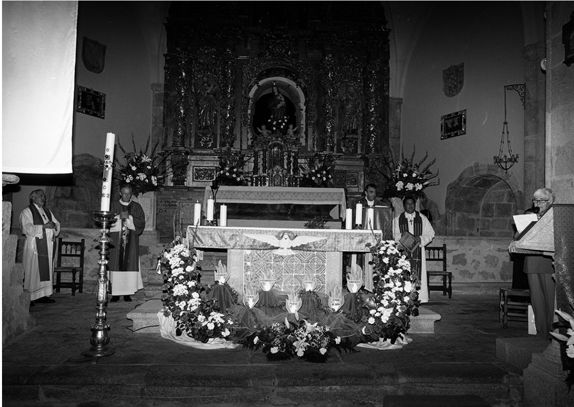
Misa con el obispo. Noviembre de 2022.