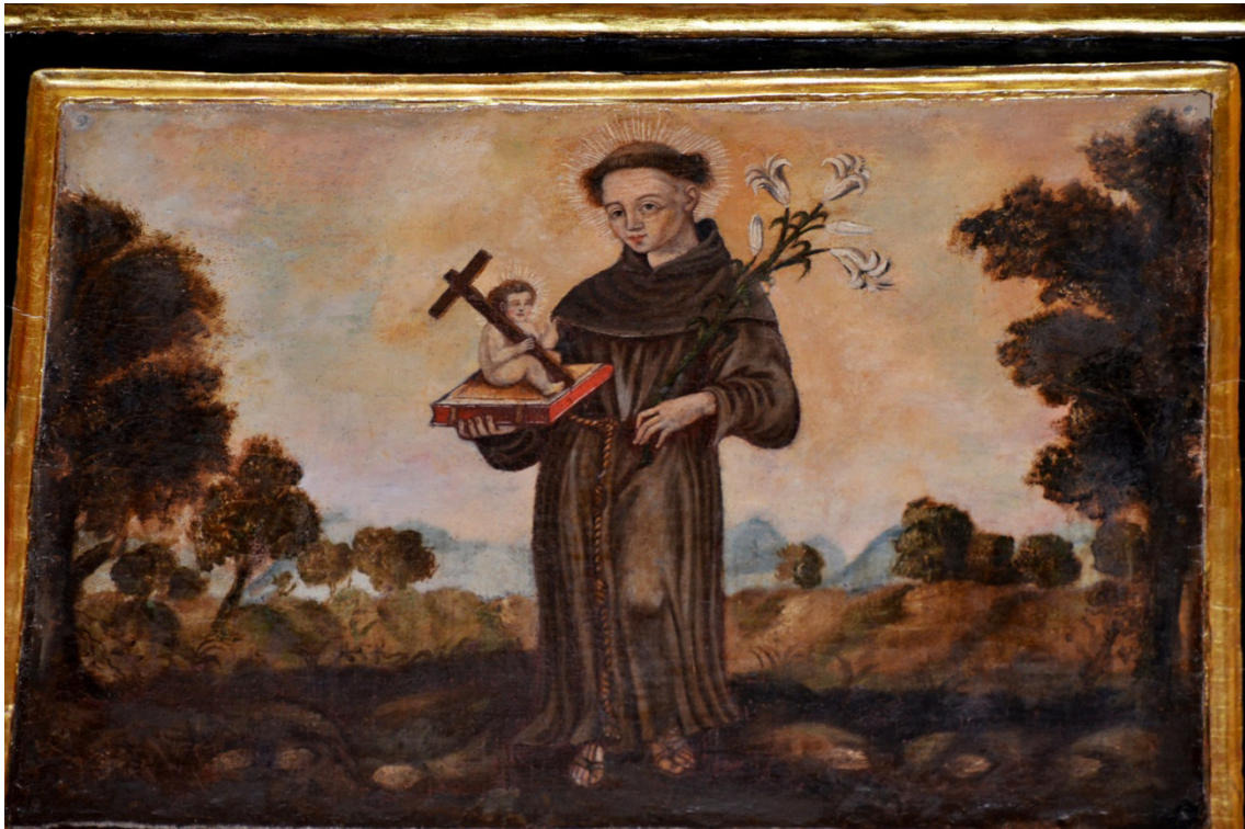
San Antonio de Padua, de la orden franciscana.

"Un divino Señor Crucificado en la sacristía en una especie de retablo". "Seis pendones (estandartes) de varios colores de las cofradías". "Dos arcas de archivo buenas, una con tres llaves donde se mete la cera y otra con dos cuyas dos llaves tiene el señor cura para meter algunos libros parroquiales y otros papeles". "Una pila pequeña para agua bendita de Talavera". "Diez libros de coro muy viejos con la Semana Santa". "Cuatro facistoles, dos grandes de coro, dos epistolarios y un tenebrario triangular". Los viejos cantorales, ya presentes a principios del siglo XVII, aún se conservaban. La mayoría de las cofradías que hemos conocido seguían en activo y guardaban sus estandartes en la sacristía.