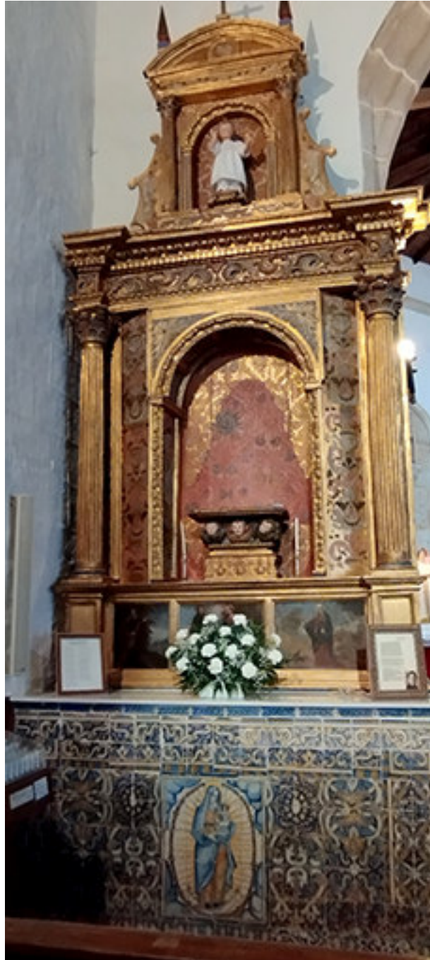
Altar de la Virgen del Rosario en Viandar de la Vera. Finales del siglo XVI o principios del XVII.

1825. Continúan las obras en el templo y las ermitas. Por primera vez aparece en el apartado de los gastos de los Mártires: " Para el convite a los diputados, 12 reales ". Puede tratarse de un antecedente de lo que hoy se llama "cena de S. Blas". Los servidores de la iglesia (curas y sacristanes) celebraban su convite habitualmente en Semana Santa.