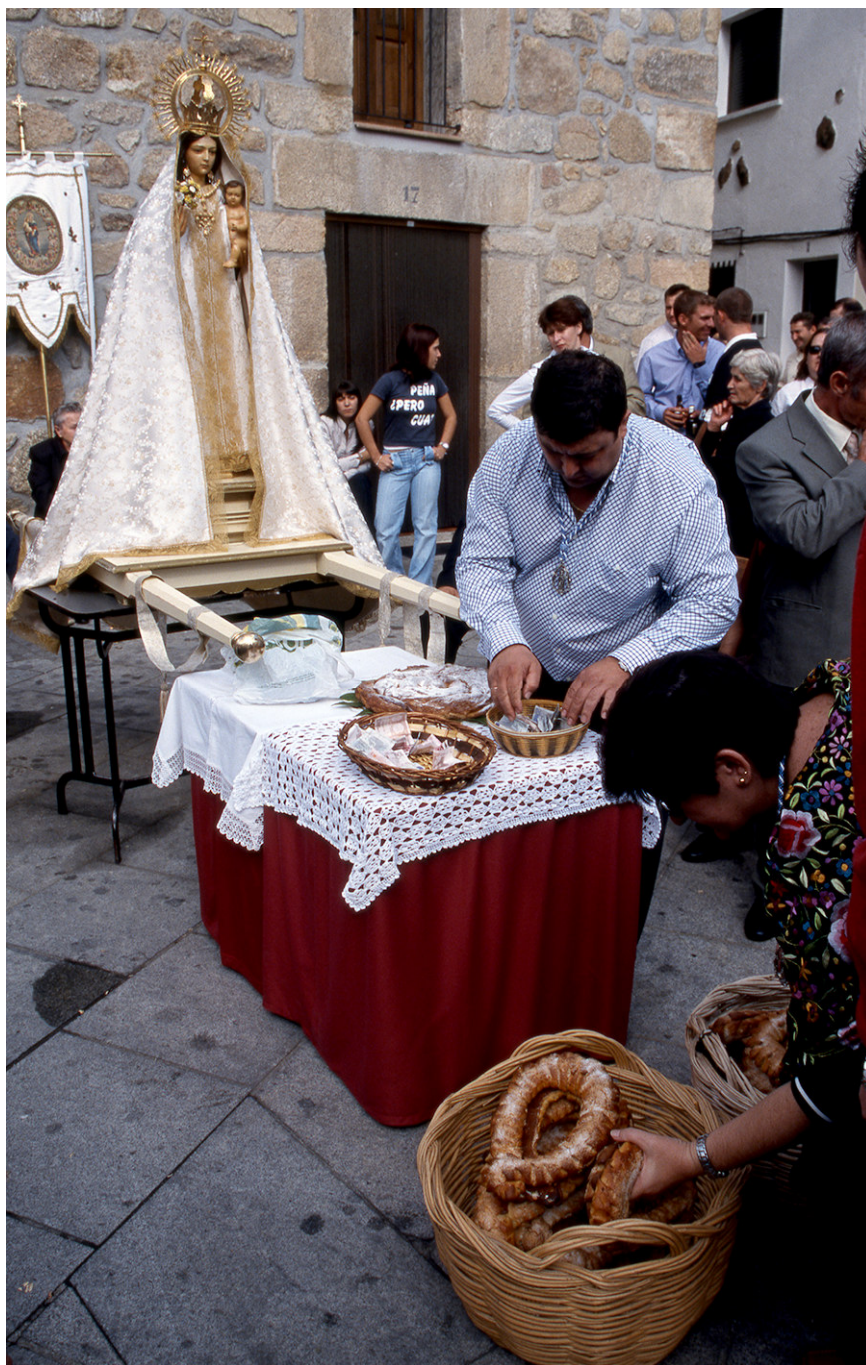
Las rosas de la Virgen del Rosario en Viandar.