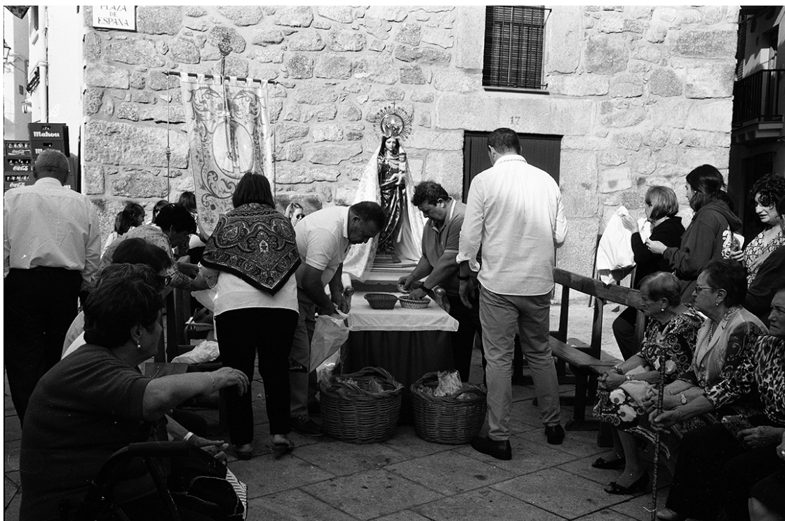
Ofertorio del Paseo de Viandar a cargo de la cofradía del Rosario. Octubre de 2024.