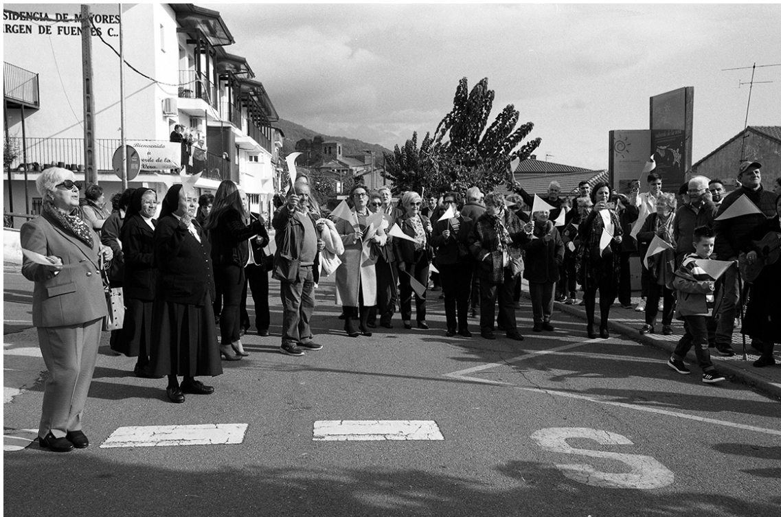
Recibiendo al obispo en noviembre de 2022.

. Que se toque el órgano en la misa mayor de las fiestas (luego el viejo instrumento aún seguía en el coro).