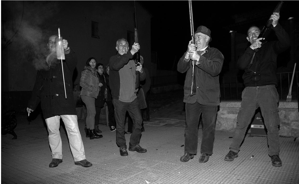
La "cena de San Blas" de 2019.