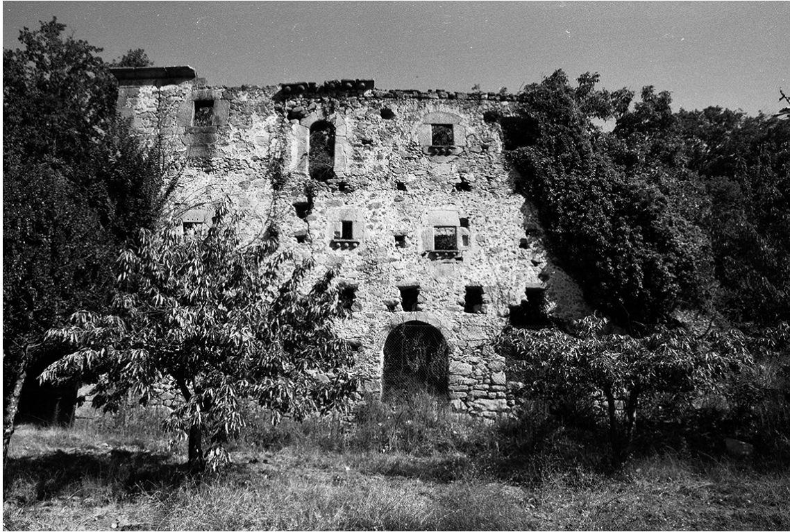
Ruinas del convento de Santa Catalina de Aldeanueva de la Vera.

Los liberales, ahora en el poder, no conciben que haya tierras de titularidad pública e insisten en privatizar los baldíos porque “es una de las providencias que más imperiosamente reclaman el bien de los pueblos y el fomento de la agricultura e industria” . El presidente de la Cortes era el cacereño Gómez Becerra.