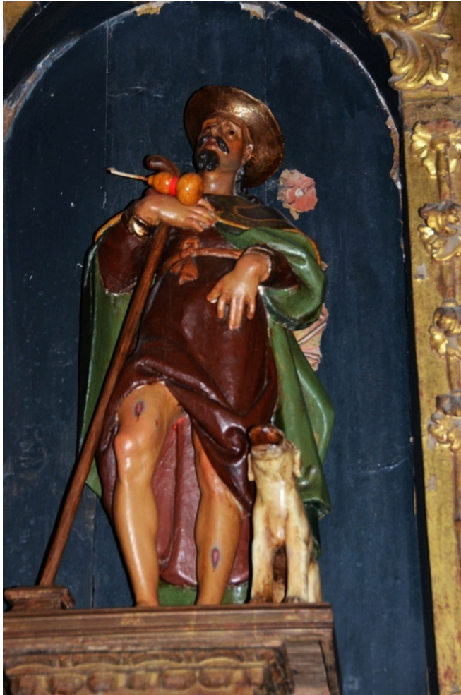
La talla de San Roque.

actualmente solo nos quedan dos pequeños cuadritos de San Antonio y Santo Domingo. Las dos primeras imágenes las conservamos aún en buen estado, pero las de Santo Domingo y San Vicente de la capilla del Rosario están en estado lamentable. Es interesante ver cómo esta capilla disponía de estos dos santos, los patronos del convento de Aldeanueva que patrocinaba la cofradía del Rosario. También se reparan una lámpara y una custodia por 24 reales.