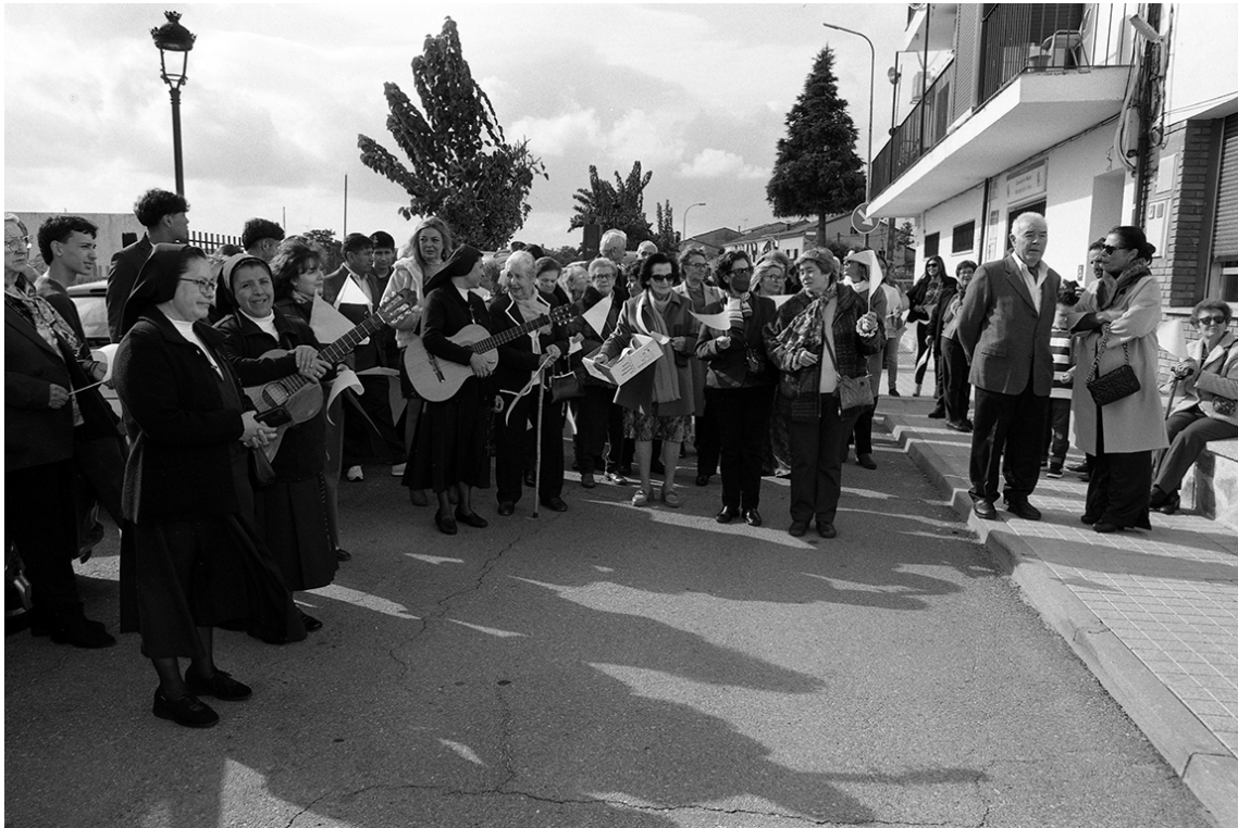
La visita del obispo. Noviembre de 2022.

Visita la parroquia el obispo de la diócesis, Pedro Casas y Souto. Entre los mandatos al párroco, el 2º punto le conmina a que "evite con diligencia los públicos escándalos de amancebamientos, borracheras, etc, valiéndose de disertaciones públicas, advertencias privadas y otros medios particulares que exijan las circunstancias, la prudencia le sugiera y un prudente y caritativo celo por el bien espiritual de sus feligreses..." . Este texto nos revela la evolución social y política durante todo este siglo en el que la iglesia ha ido perdiendo poder sobre las costumbres; años atrás "el amancebamiento" de parejas en el pueblo les hubiera costado muy caro, incluida la cárcel. También ordena el obispo que se toquen diariamente las campanas en la hora del Ángelus; esta costumbre aún continúa en Valverde.