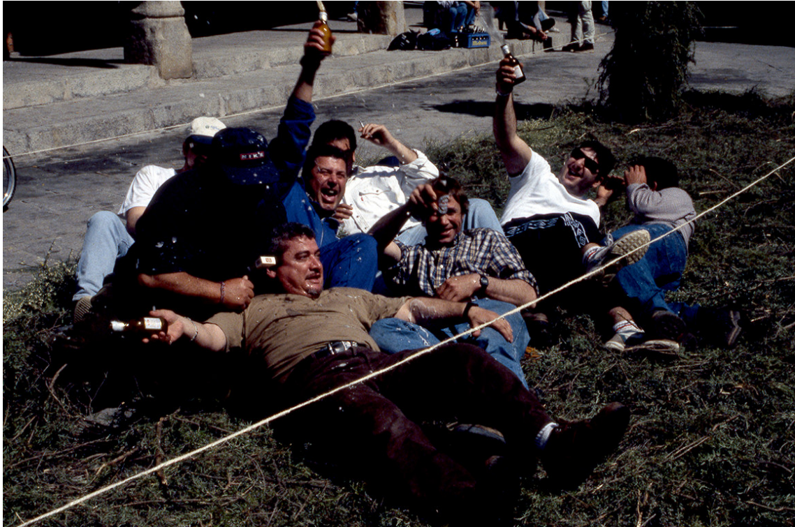
El "refresco" de los arcos. Abril de 1.999.

1818. Las arcas del estado necesitan más dinero; una medida para obtenerlo era seguir vendiendo y privatizando los terrenos públicos; una Real Cédula ordenaba la venta de baldíos, realengos, despoblados y mostrencos para el pago de los intereses y amortización de la deuda pública. En todo el proceso privatizador se han cometido errores y excesos debido a la confusión existente sobre si los bienes comunes eran de propios, baldíos o dehesas y se ordena revisar las ventas irregulares. Los campesinos pobres no pudieron beneficiarse de la venta de terrenos porque su precio de las tierras no podía bajar del tasado por el Estado.