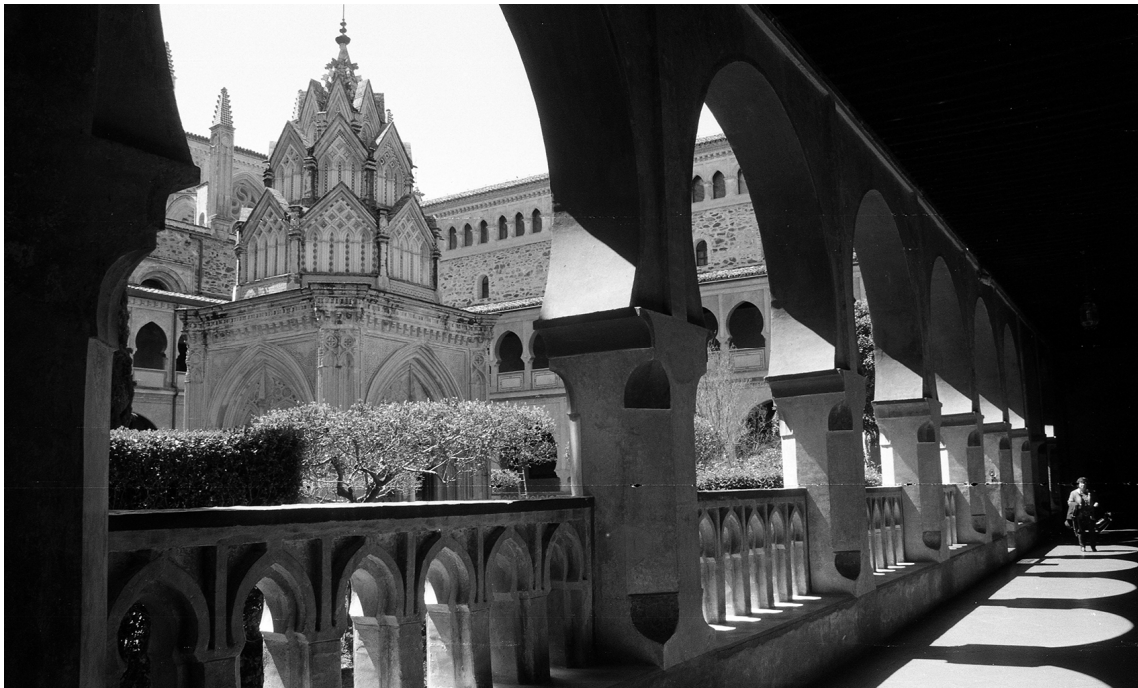
El claustro mudéjar del monasterio de Guadalupe.